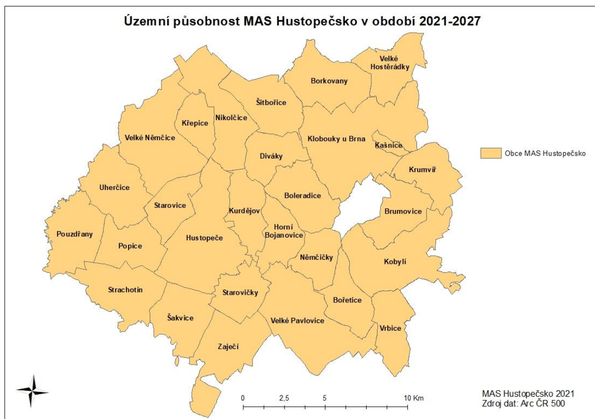
Obrázek 1 Území působnosti MAS Hustopečsko s vyznačením hranic obcí

MAS Hustopečsko změnila svou územní působnost oproti období 2014-2020. Došlo ke snížení počtu o jednu obec, konkrétně se jedná o Morkůvky. Zde zastupitelstvo obce neschválilo zapojení obce do územní působnosti MAS Hustopečsko pro období 2021-2027, viz. bílé místo v mapě (obrázek 1). Došlo tedy ke snížení počtu obcí z 29 na 28.